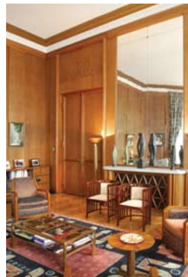
Dva barokna svećnjaka u trpezariji, © foto: MAE - Martin Fraudeau Ambasadorova kancelarija, © foto: Dragan Babović

Na suprotnom kraju zdanja nalazi se kabinet ambasadora čiji su zidovi presvučeni drvetom. Izuzetno topla prostorija sa pogledom na reku čuva dve stolice u stilu Frenk Lojd Rajta, fotelje i stočić u stilu Art deko.