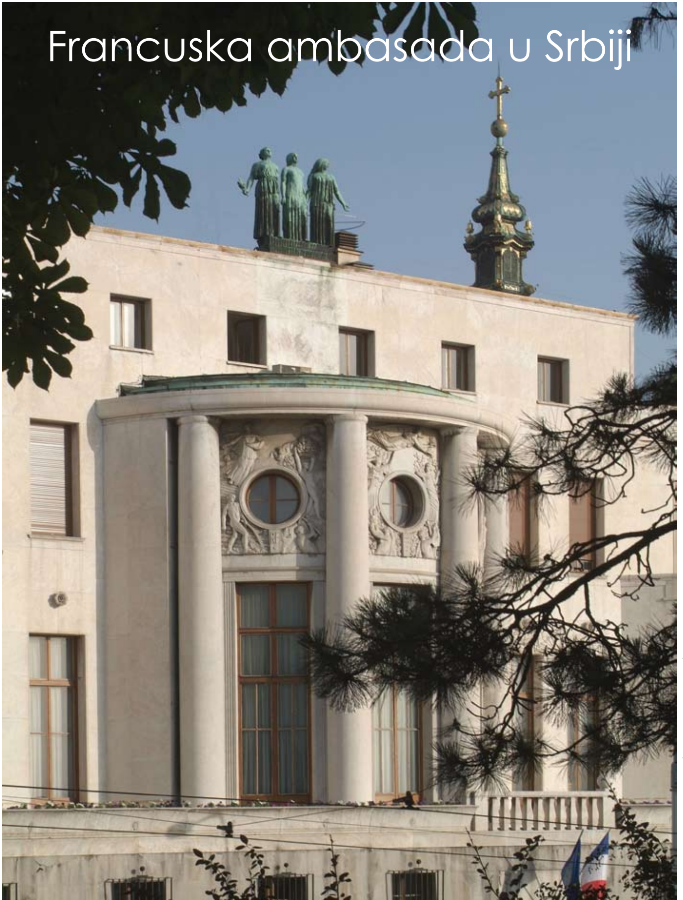
Francuska ambasada, fasada

FRANCUSKA AMBASADA U SRBIJI Pariska 11, 11 000 Belgrade - Tel : (381.11) 302 35 00 - Fax : (381.11) 302 35 10 Site : www.ambafrance-srb.org