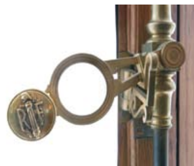
Salon sa stubovima sa Rotondom u dnu, © foto: Dragan Babović Plitki reljefi u Rotondi (detalji), © foto: Dragan Babović Medaljon sa prikazom reke Sena, © foto: Branko Pantelić Znak "RF" na kvaci, © foto: Dragan Babović

Dva elegantna okrugla stola ispred prozora koji gledaju na unutrašnje dvorište sa fontanama, nova su i ručno rađena u Art deko stilu. U sredini ploča stolova inkustriran je šestougao-nheksagon, kako iz milošte Francuzi tepaju obliku svoje zemlje. U Francuskoj još uvek ima kvalitetnih zanatlija koje na starinski način rade po porudžbini!